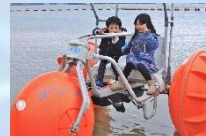
水上三輪車 『アクアサイクル』