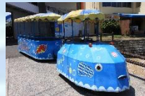
『ふくちゃん号』 1人100円で送迎