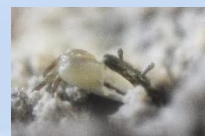
潮だまりで 小さな生き物観察